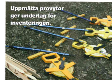
Uppmätta provytor ger underlag för inventeringen.